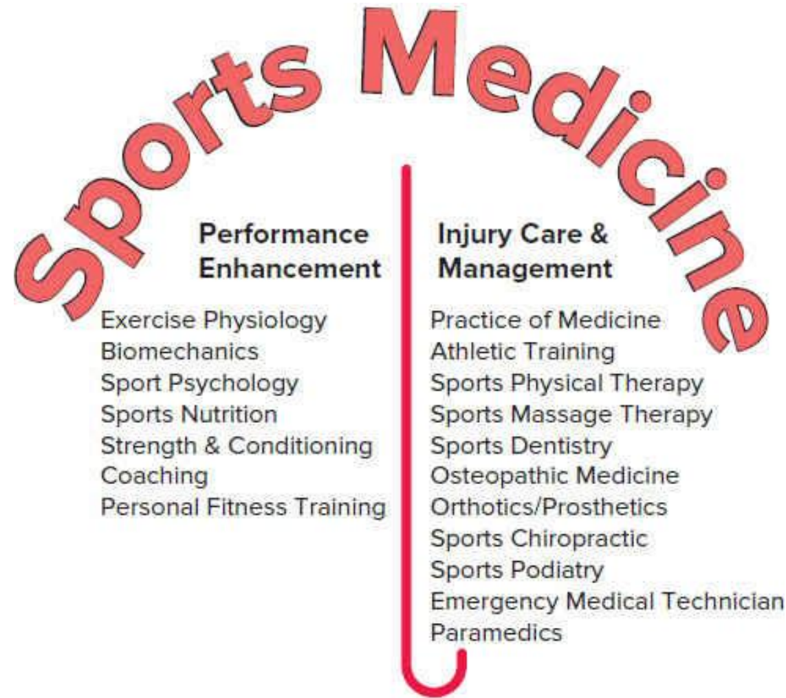
FIGURE 1–2 Areas of specialization under the sports medicine “umbrella.”